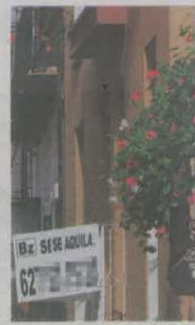
Cartel de alquiler en la fachada.

La petición de avales o de depósitos es escasa fuera de las grandes urbes. Según constatan en Sacacasa.com, en las ciudades pequeñas los contratos verbales y los alquileres que no se suelen declarar a Hacienda tienen todavía mucho peso.